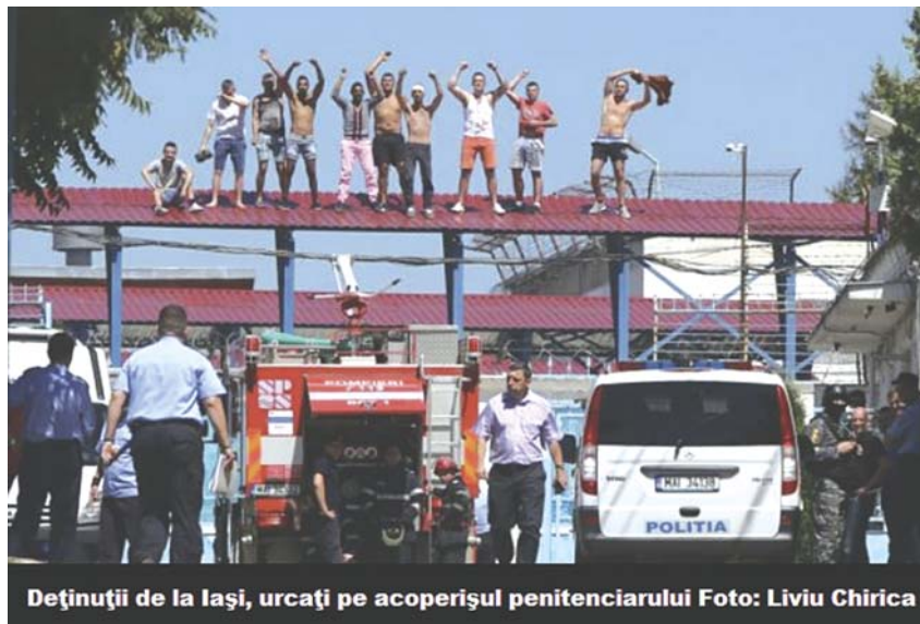
De]inu]ii de la Iași, urca]i pe acoperișul penitenciarului